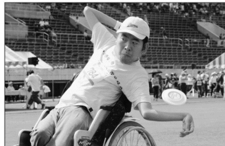
後ろ向きになって...